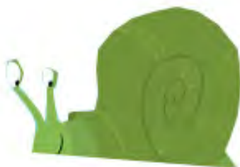
Illustration copyright © 2005 by Noah Z. Jones.