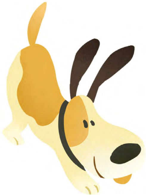
Illustration copyright © 2005 by Noah Z. Jones.