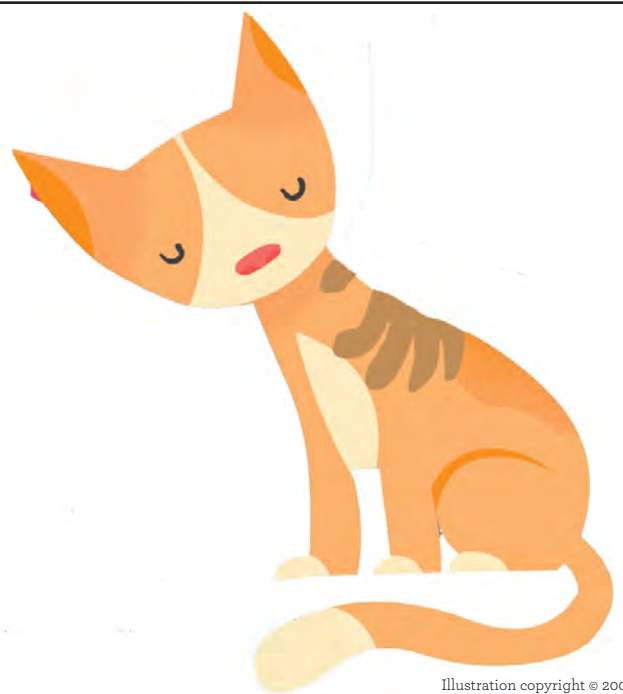
Illustration copyright © 2005 by Noah Z. Jones.