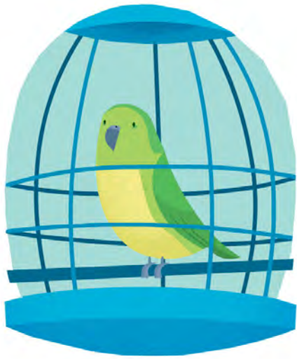
Illustration copyright © 2005 by Noah Z. Jones.