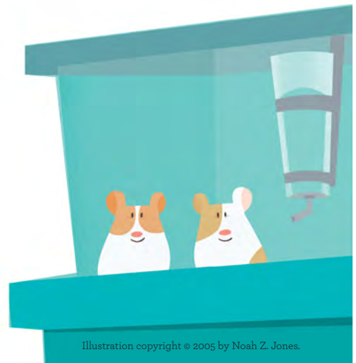
Illustration copyright © 2005 by Noah Z. Jones.